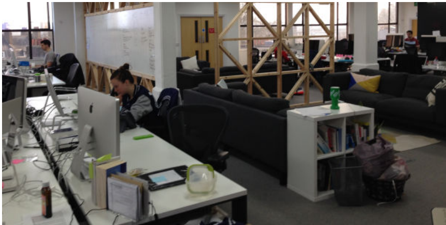
L'organisation des bureaux en open space pénalise la productivité des actifs.

Par Hugo Baudino ( /journalistes/hugo-baudino-253 ) | 04/11/2016, 8:00 | 409 mots